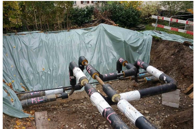
Einbindung neues Fernwärmetrasse in best. Netz