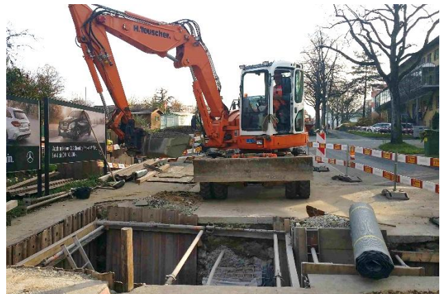
Erstellung Ortbetonschacht für Auspeisung Fernwärme