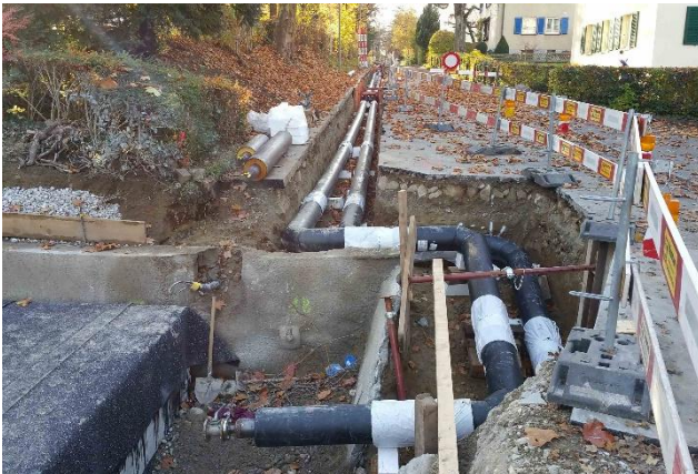
Neue Fernwärmetrasse (inkl. Anbindung Quartierzentrale)

Bauherrschaft: Energie Wasser Bern Bauvorhaben: Erneuerung Wasser- und Elektroanlagen Erweiterungen und Ausbau des Fernwärmenetzes Kosten: Unternehmer: ca. CHF 1'000'000.- Honorare: ca. CHF 90'000.- Ausführung: 2015 – 2016 Phase 52 – Ausführung Projekt: Erneuerung der Wasser- und Elektroanlagen in der Wohnzone Erstellen von diversen neuen Hausanschlussleitungen mittels Schlagvortrieb Neubau Fernwärmeleitung zur Ergänzung des best. Netzes (inkl. Anbindung Hochtemperatur) Besonderes: Ortbetonschacht und -kanal für Anspeisung Quartierzentrale Fernwärme (Hochtemperatur)