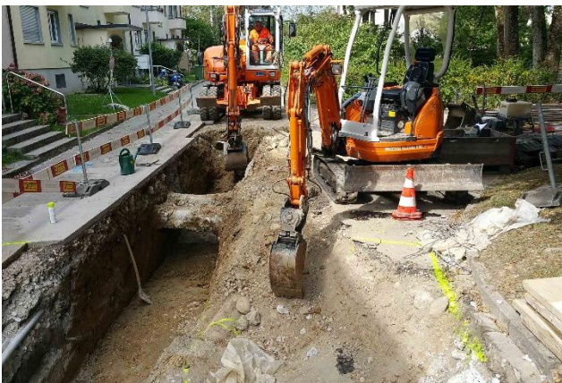
Grabarbeiten für neue Werkleitungen