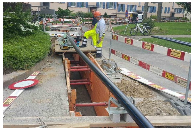
Erstellung neue Wasserleitung HDPE