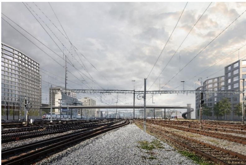
Visualisierung Negrellisteg über Gleisfeld Visualisierungen © nighturnurse images gmbh