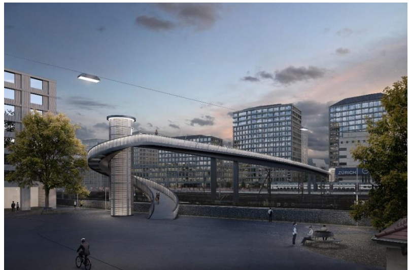
Visualisierung Treppenaufgang Seite Zollstrasse