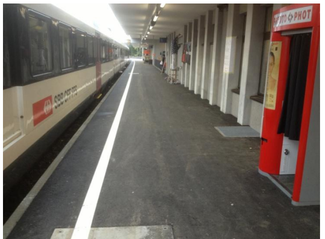
Perronerhöhung P55 inkl. Anschlüsse Aufnahmegebäude