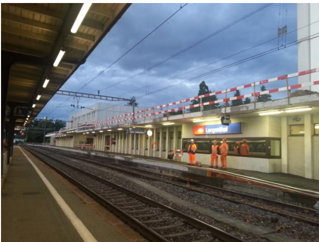
Perronerhöhung P55 und Anpassung Perrondach