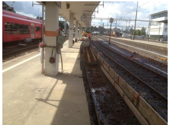
Erstellen der neuen Perronkante