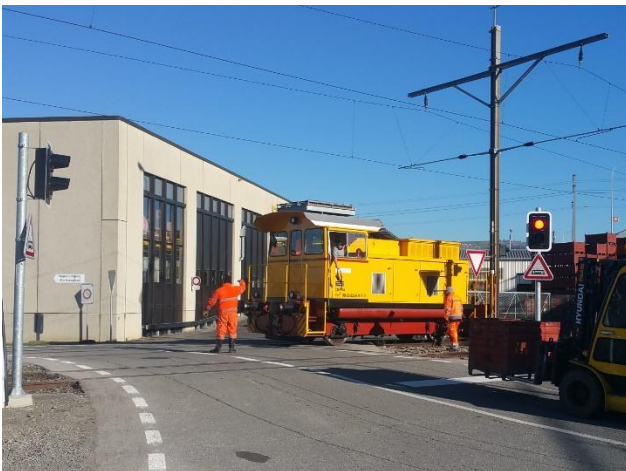
Bahnübergang mit normgemässer Lichtsignalanlage (automatische Einschaltung; gelb blinkend, gelb, rot)

Bauherrschaft: armasuisse Immobilien, Baumanagement Mitte Bauvorhaben: Sichern von vier Bahnübergängen im Anschlussgleisbereich des Wpl. Thun Kosten: Unternehmer: ca. CHF 380'000.- Honorare: ca. CHF 55'000.- Ausführung: 2014 Phase 32 Bauprojekt 2014 – 2016 Phase 33 Bewilligungsverfahren, Auflageprojekt 2014 Phase 41 Ausschreibung 2016 Phase 51 – 52 Ausführungsprojekt / Ausführung 2017 Phase 53 Inbetriebnahme, Abschluss Projekt: Aufgrund eines Unfalles mit Sachschadenfolge sowie der geänderten gesetzlichen Bestimmungen vollziehen eines Regimewechsels auf der Anschlussgleisanlage Wpl. Thun (Strassenbahn- anstatt Eisenbahnbetrieb) sowie dem entsprechenden sichern von vier Bahnübergängen. Besonderes: Erwirken Ausnahmebewilligung beim BAV für Anlage mit warnendem Charakter (inkl. aller dazu nötigen Nachweise, Belege und Wirtschaftlichkeitsberechnungen) Anpassen strassenseitige Vortrittsregelung, neue Beschilderung und Markierungen im Strassenbereich Erstellen neue Betriebsvorschriften Anschlussgleisanlage