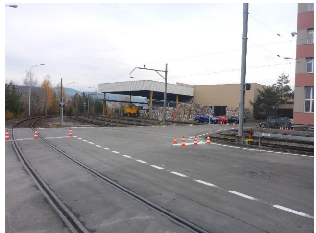
Markierungsarbeiten am Bahnübergang mit warnendem Charakter (blinkende Signale)