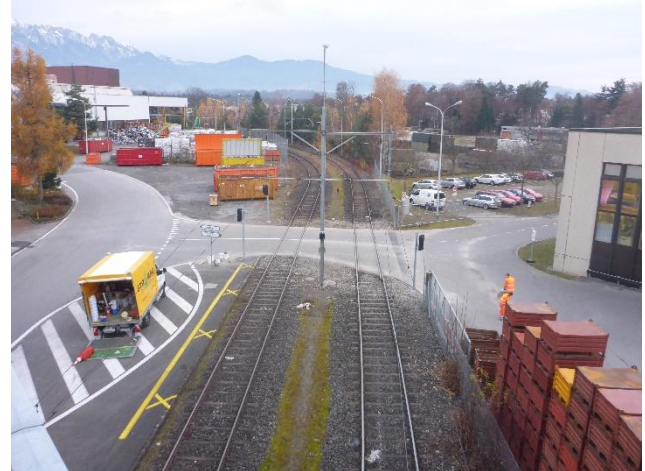
Ändern des strassenseitigen Verkehrsregimes (Vortrittsregelung zur Erhöhung der Nutzungssicherheit)