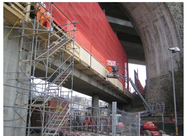
Brücke über die Worblentalstrasse mit Schutzwand gegen die bestehende Strecke (SBB und A1).